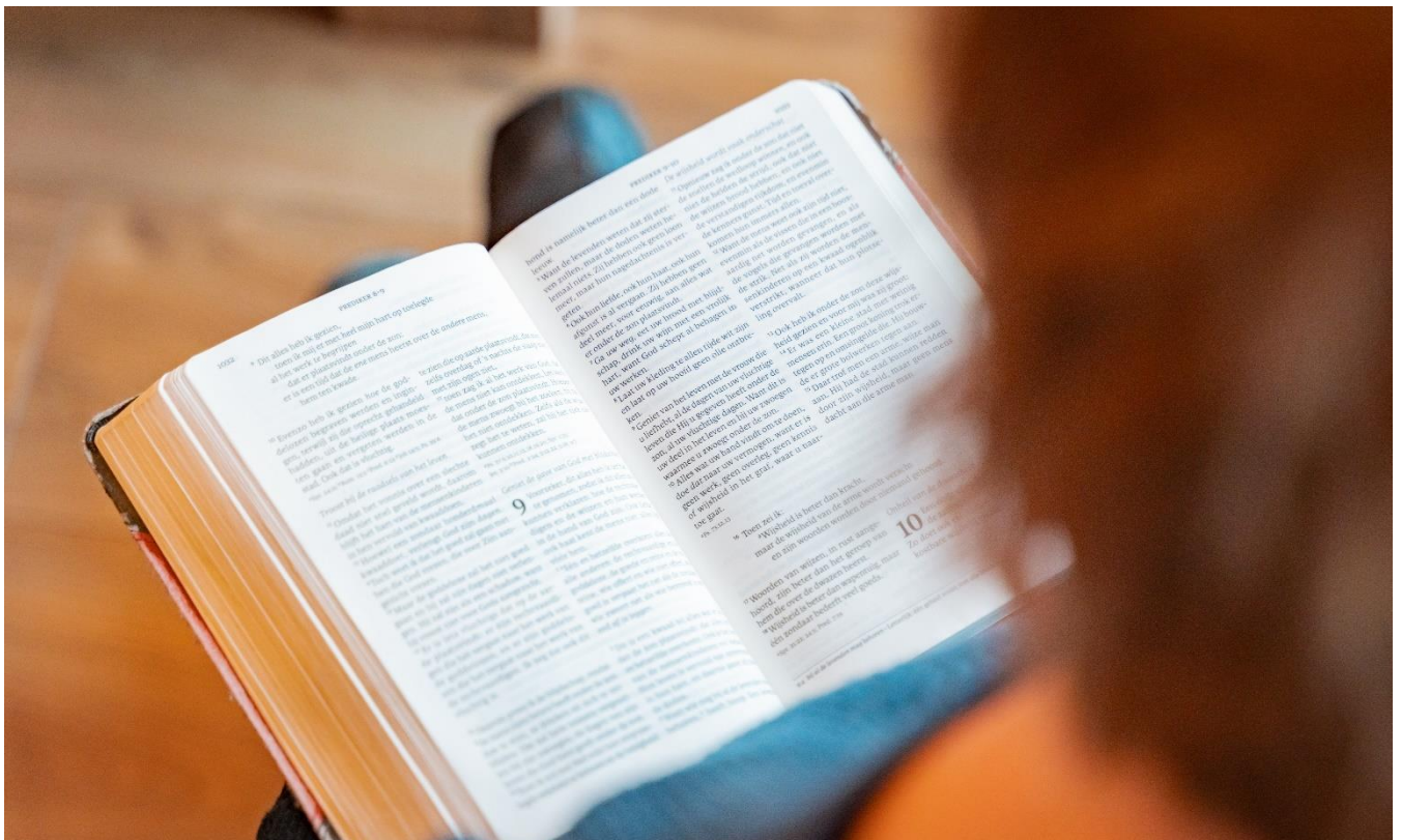
Twee groepen lezen de Bijbel volgens een vast rooster

Diverse groepen zijn met elkaar bezig om geloof handen en voeten te geven. Zo wordt de Bijbel door twee groepen gelezen. Eén groep leest de Bijbel in één jaar door via een vast rooster met toelichting. Een andere groep leest elke dag een Bijbelgedeelte aan de hand van een rooster van Youversion. De groepen hebben contact via een WhatsApp groep.