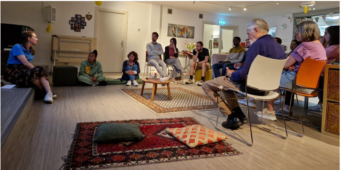
Gebedsavond bij Hart voor West

W e geloven dat de Heere God ons Hart voor West heeft gegeven en dat Hij deze plek heeft gewild. Door de crisis heen hebben we ons gebouw en onze gemeenschap van Hem ontvangen. Dat was een luisterproces. En dat luisterproces blijft nodig, als het gaat om verdere strategische stappen en als het gaat om de inhoud van de prediking. Hoe geven we dit luisteren vorm bij Hart voor West? Dit doen we allereerst door veel aandacht te geven aan gebed. Op een andere plek in dit jaarverslag wordt dit uitgebreid toegelicht. Door de jaren heen hebben we geleerd om alles wat we doen eerst bij God te brengen. Start de Alphacursus? Dan gaan we eerst een gebedsavond houden waarin we bidden of God mensen op ons pad zal brengen. Hebben we een heidag? Dan willen we eerst als team en als bestuur de tijd nemen om naar God te luisteren door allemaal persoonlijk stil te worden voor Hem.