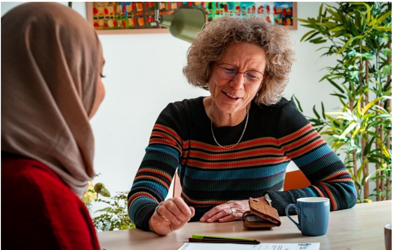
Inlooppreekuur bij Thuis in West

D e wijk waarin we wonen en werken, is behoorlijk kwetsbaar. We komen verslaving tegen, er is prostitutie, er is relatieproblematiek, er is armoede en er is eenzaamheid. Juist in deze context kunnen we aan de mensen iets van Jezus laten zien. Soms zeggen we grappend tegen een gevestigde kerk: “Onze gemeente is tien keer zo klein als jullie gemeente, maar onze diaconie is tien keer zo groot als die van jullie.” En dat klopt in de praktijk. Om het diaconaat naar buiten gestalte te geven, is de buurtorganisatie Thuis in West opgericht.