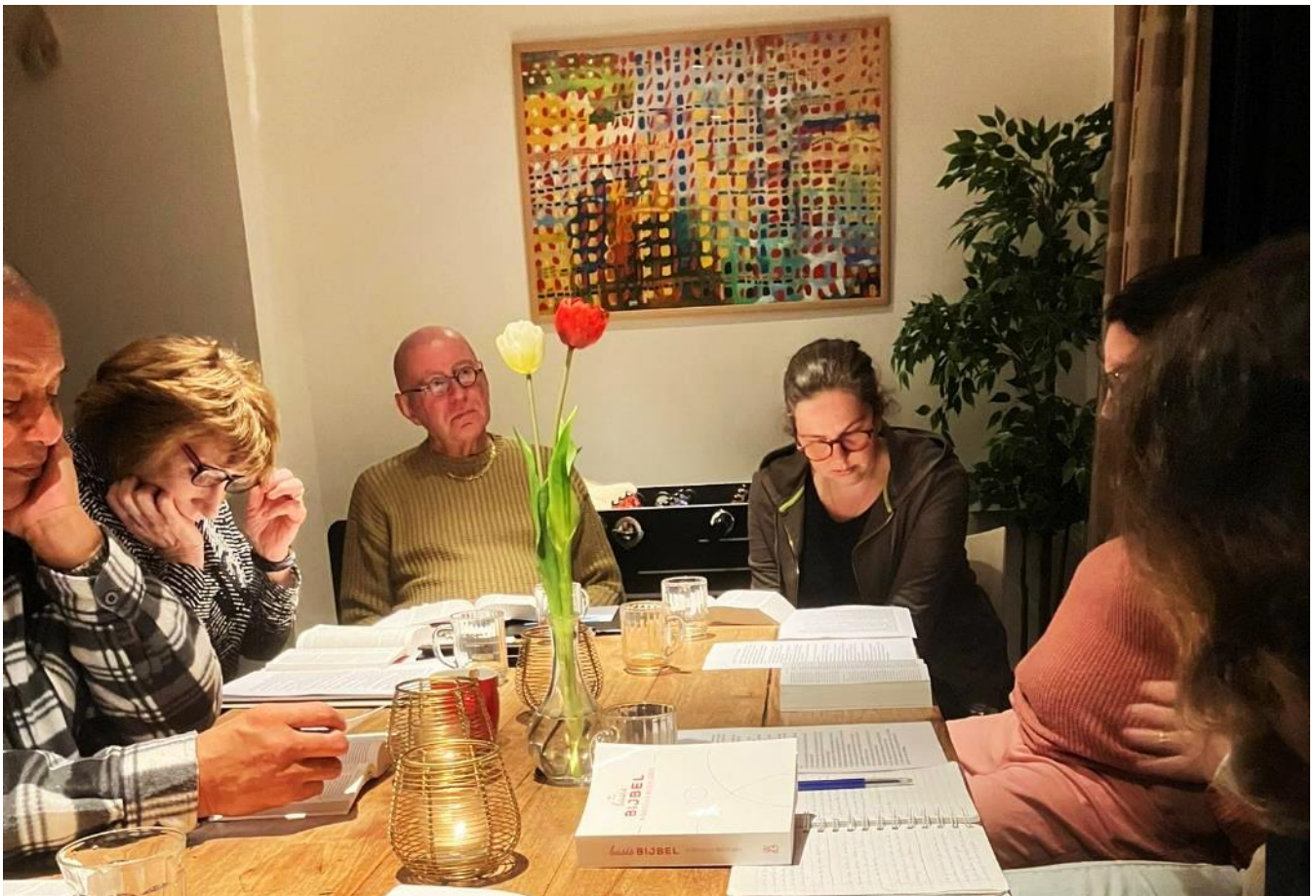
Deelnemers van de Betacursus

In een serie van ongeveer 10 avonden wordt de leer van de Bijbel verkend met een heel diverse groep mensen. Er zijn twee mensen bij met een islamitische achtergrond, er zijn ook mensen die zonder geloof zijn opgegroeid. De gesprekken gaan diep. Alle vragen mogen gesteld worden. Het programma van een avond kan soms omgegooid worden omdat de cursisten daar behoefte aan hebben.