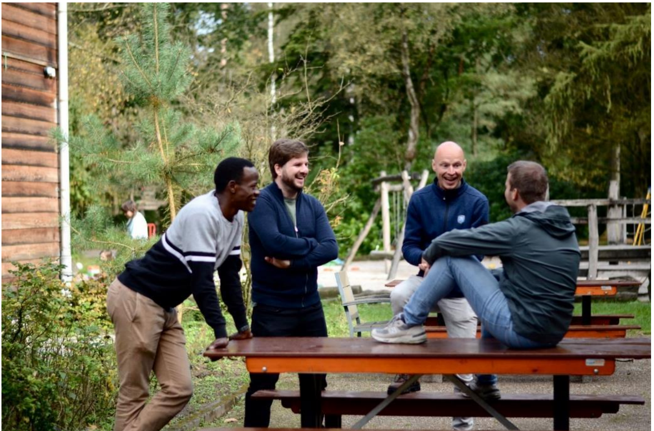
Onderonsje tijdens ons Hart-weekend

Een hoogtepunt is verder het Hart-weekend wat we houden in september in Oisterwijk. Met ongeveer 60 personen genieten we van een mooie mix van ontspanning en bezinning. Deze weekends zijn altijd weer momenten waar we een sterke verbinding ervaren en voelen dat we één familie zijn.