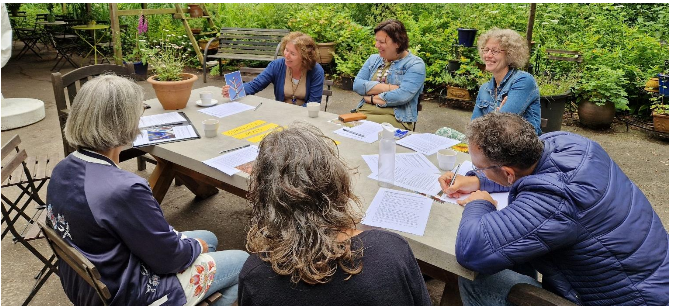
Heidag met het team

H et team van Hart voor West is heel divers, en daar zijn we heel blij mee. De een heeft talenten voor jongerenwerk, de ander is meer toegerust voor pastoraat, een derde is praktisch ingesteld en kan goed zorgen voor groepen. In de loop van de jaren zijn we op elkaar ingespeeld. Om niet alleen maar bezig te zijn met het leven van elke dag, trekken we ons een paar keer per jaar terug als team om na te denken over beleid. Dat gebeurt elk jaar op een landelijke bezinningsdag van de Pioniersbeweging. En verder is er in het voorjaar altijd een heidag , waar we samen met de collega's van Thuis in West nadenken over ons gezamenlijke beleid.