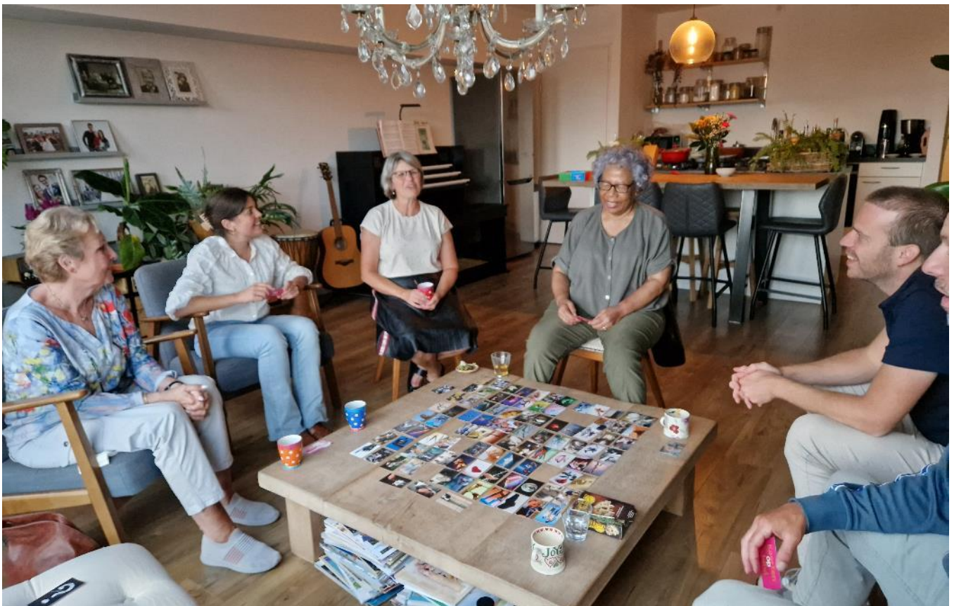
Een huisgroep-bijeenkomst met ‘kaarten op tafel’