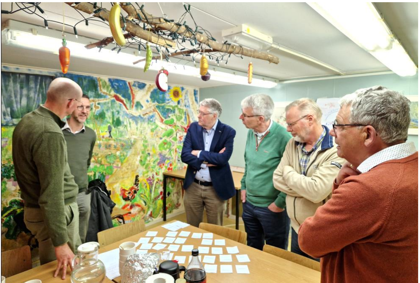
Het bestuur tijdens de heidag onder leiding van een coach

Verder exploiteert het bestuur ook het gebouw van Hart voor West. De leden van de leefgemeenschap huren een appartement. Ook Thuis in West en de Chinese gemeente betalen huur, evenals incidentele huurders. Van de huuropbrengsten wordt het gebouw afbetaald en wordt het onderhoud gefinancierd. Op termijn zullen de huuropbrengsten grotendeels ingezet kunnen worden voor het werk in de wijk.