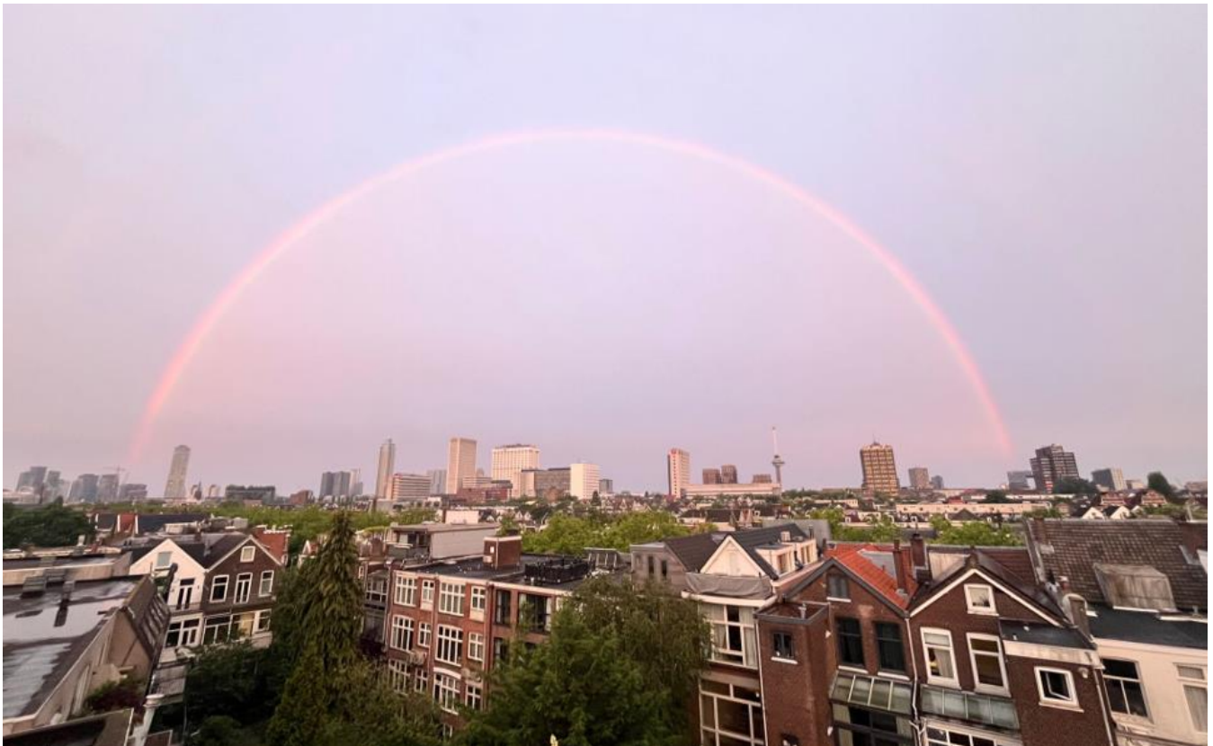
De regenboog als symbool van Gods trouw over de stad; genomen vanaf ons dakterras

Na een leeskringavond die onder meer ging over vasten is een deel van de groep tot de overtuiging gekomen dat vasten niet optioneel is, maar een wezenlijk onderdeel van het christenleven. Regelmatig wordt gevast, vaak met een concreet doel. Tijdens een vastendag komt de groep samen om met elkaar te bidden.