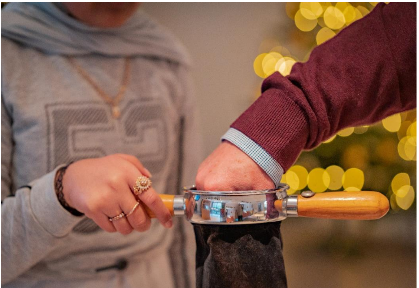
Regelmatig collecteren we voor diaconale doelen

E en kleine kerkelijke gemeenschap als Hart voor West kan heel weinig betekenen voor wereldwijd diaconaat. Toch is het ons verlangen om hier aandacht aan te geven. In de vieringen wordt gebeden voor de nood in de wereld. Regelmatig collecteren we voor een diaconaal doel, dichtbij of verder weg. Ook in de prediking is regelmatig aandacht voor de nood in de wereld. Op deze manier mogen we een klein steentje bijdragen aan de nood van onze naaste verder weg. Zo werken we ook aan het bewustzijn van deze nood bij onze leden.