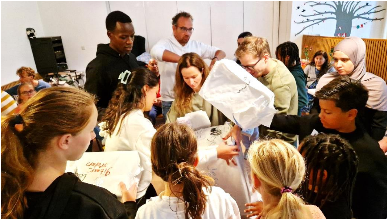
Creatieve bezinning tijdens het Hart-weekend

De jongste gast is nog geen jaar, de oudste is 80-plus. En allemaal genieten ze helemaal op hun eigen manier. Er worden spellen gedaan, er wordt lekker gegeten, we maken een wandeling in de omgeving en er zijn veel gesprekken tussen de bedrijven door. Een happening is de medaille die rondgaat voor bijzondere verrichtingen. Bij elke maaltijd mag deze uitgereikt worden door degene die hem in bezit heeft.