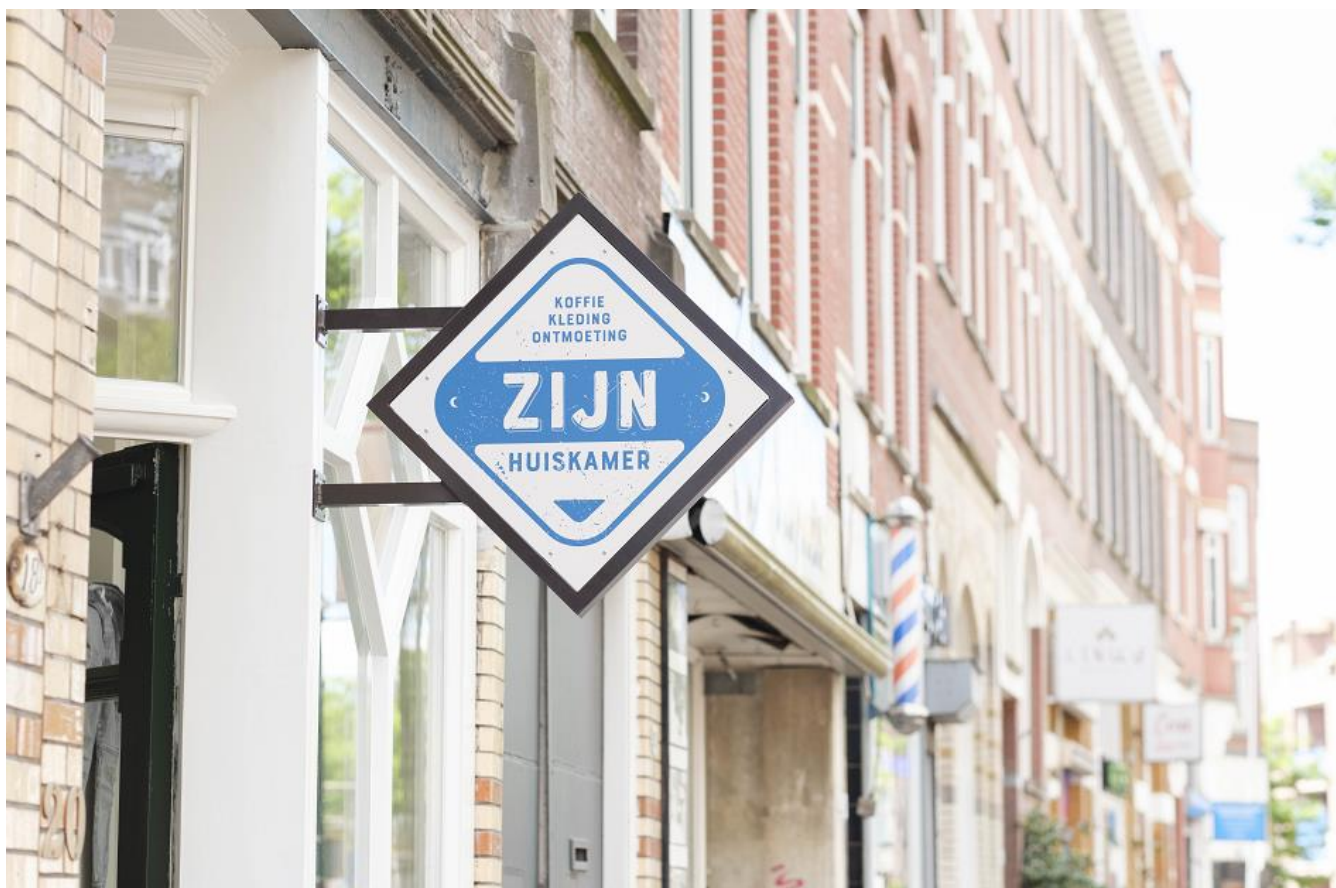
ZIJN huiskamer aan de Vierambachtstraat

E en pioniersplek heeft iets van een onderneming in zich. Het is spannend om er aan te beginnen en te zien of het lukt om 'het hoofd boven water te houden'. Maar áls dat lukt, is er ook altijd de vraag: hoe kunnen we dit vermenigvuldigen? Hoe kunnen we doorgaan op het pad dat we zijn ingeslagen. Ons verlangen is al enkele jaren om ons werk te verbreden naar aangrenzende wijken: het Oude Westen en het Nieuwe Westen. In 2024 lukt dit; we starten vanuit Thuis in West een project in het Nieuwe Westen, samen met 24-7 Prayer, onder de naam ZIJN huiskamer . Het is een leuke koffietent waar ook tweedehands kleding wordt verkocht. Deze plek heeft in eerste instantie een diaconale insteek en valt onder Thuis in West. Maar we merken na enkele maanden al effect op ons missionaire werk. Enkele bezoekers van Hart voor West hebben via deze nieuwe plek de weg naar ons gevonden. Mogelijk huren we deze plaats later ook voor missionaire activiteiten.